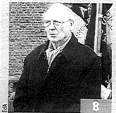
Genappe II avait été bourgmestre et parlementaire