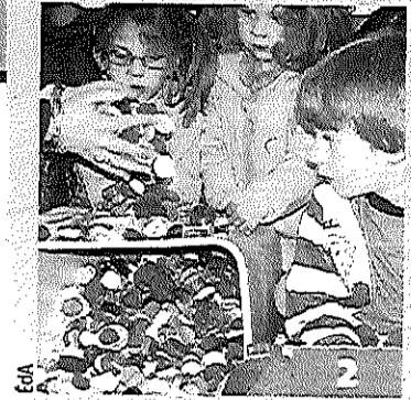
Brabant wallon Déjà cinq tonnes de bouchons